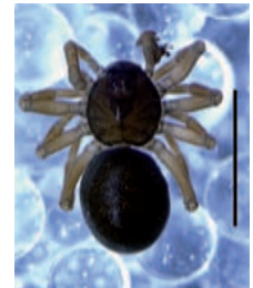
4 Alkoholpräparat des nachgewiesenen Männchens von Pelecopsis alpica (Linyphiidae, Zwerg- und Baldachinspinnen). P. alpica konnte erstmals im Rahmen der vorliegenden Untersuchung in der Schweiz nachgewiesen werden. (Massstab: 1mm)

• Meioneta alpica (Linyphiidae, Zwerg- und Baldachinspinnen). Ein Männchen (cf., Identität nicht eindeutig) und sieben Weibchen wurden ( M. alpica zugeordnet) während der Untersuchung am Standort 3 (vgl. Liste der