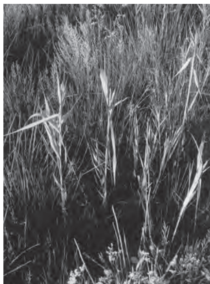
Slika 4. Mendoza canestrinii (Ninni, 1868), gnijezdo u uvijenom („šivanom“) svježem središnjem listu trske ( Phragmites ), EN-D.

Figure 3. Sitticus floricola (C. L. Koch, 1837), nest on a sedge leaf ( Carex ), EN-C.