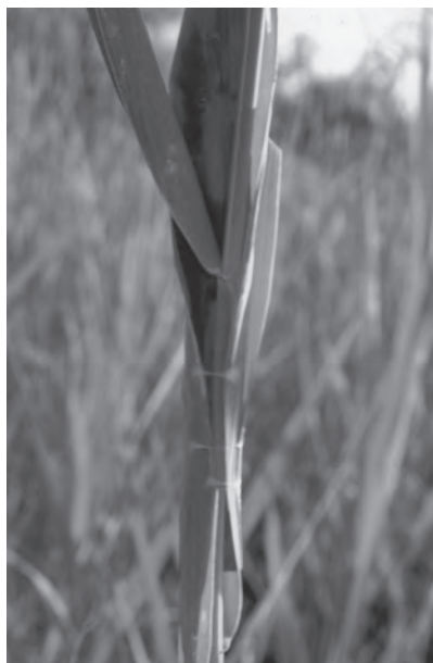
Slika 3. Sitticus floricola (C. L. Koch, 1837), gnijezdo na listu šaša ( Carex ), EN-C.

Figure 2. Sitticus inexpectus Logunov & Kronestedt, 1997, nest on a reed leaf ( Phragmites ), EN-C.