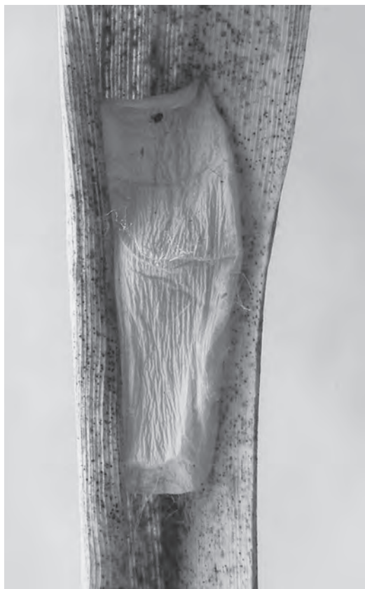
Slika 5. Nerazvijeni primjerci trske ( Phragmites ) kao EN-B pauka skakača (Araneae: Salticidae) u Hrvatskoj.

Figure 5. Underdeveloped reed ( Phragmites ) samples as EN-B of jumping spiders (Araneae: Salticidae) in Croatia.