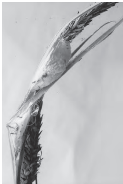
Slika 2. Sitticus inexpectus Logunov & Kronestedt, 1997, gnijezdo na listu trske ( Phragmites ), EN-C.

Figure 2. Sitticus inexpectus Logunov & Kronestedt, 1997, nest on a reed leaf ( Phragmites ), EN-C.